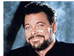
William T Riker