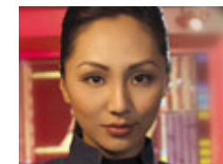
Alfers Hoshi Sato

humanidade na colonização e exploração espacial, sua falta de experiência nos contatos com alienígenas e sua capacidade de superar essas dificuldades.