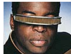
Georgi La Forge