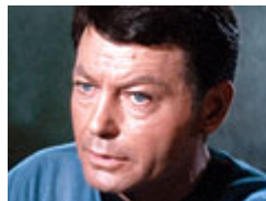
Dr Leonard H McCoy