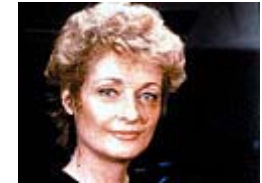
Dra Katherine Pulaski

Nos EUA, estreou em 28 de Setembro de 1987 com o episódio piloto de duas horas Encontro em Farpoint.