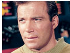
Cap James T Kirk