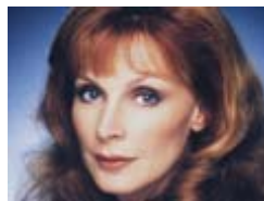
Dra Beverly Crusher