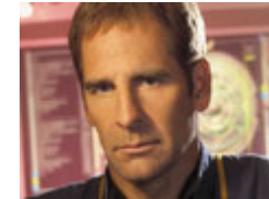
Cap Jonathan Archer

Esta série narra as dificuldades iniciais da exploração do espaço, seus conflitos com os Vulcanos que tentam retardar a entrada da