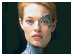
Seven of Nine